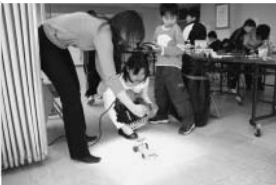
勢いよく走るソーラーカーに歓声を上げていました。

3月28日に春休みお楽しみ教室「電気を使って、遊んで学んで！」が、中央公民館で開かれ、小学生 16 人が参加しました。北海道電力の職員が講師を務め、発電や電気が家庭に届くまでの仕組みなどを学んだ後、太陽光発電パネルを組み込んだソーラーカーの模型作りに挑戦。ハロゲンライトを当てると勢いよく走る車に歓声を上げていました。