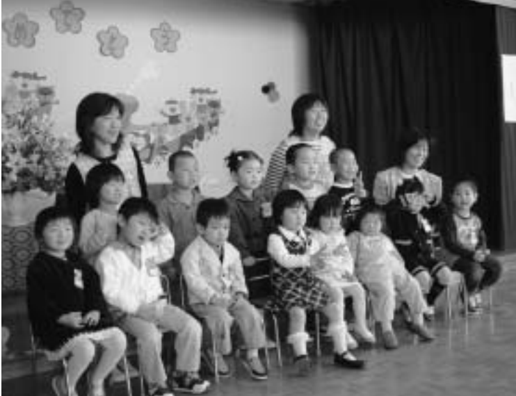
園児や保護者、地元住民ら約 30 人が参加し、新たな出発を祝いました。