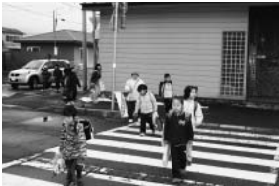
児童らは「おはようございます」と元気な声を返し登校。

4月11日から13日までの間、児童を交通事故から守ろうと浦幌町生活安全推進協議会では通学路の交差点などで街頭指導を実施しました。この取り組みは、新入学時期に併せて毎年実施され、交通安全協会、女性ドライバー友の会、浦幌ライオンズクラブの会員がボランティアで参加。歩道を渡る児童に「車に注意して渡ってね」と声を掛けていました。