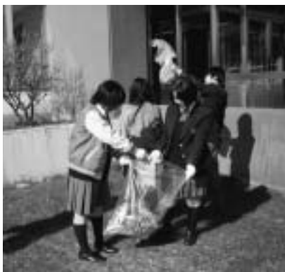
寒い中でも熱心にごみを拾う生徒たち。

■5月8日(月)、全校生徒で校舎周辺のゴミ拾いを行いました。風が吹き、気温も10度前後と、良い状況ではありませんでしたが、1時間の協同作業は滞りなく終了することが出来ました。■本来なら新年度、新た