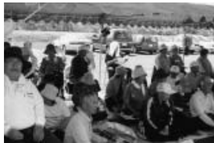
記録を残すより記憶に残す