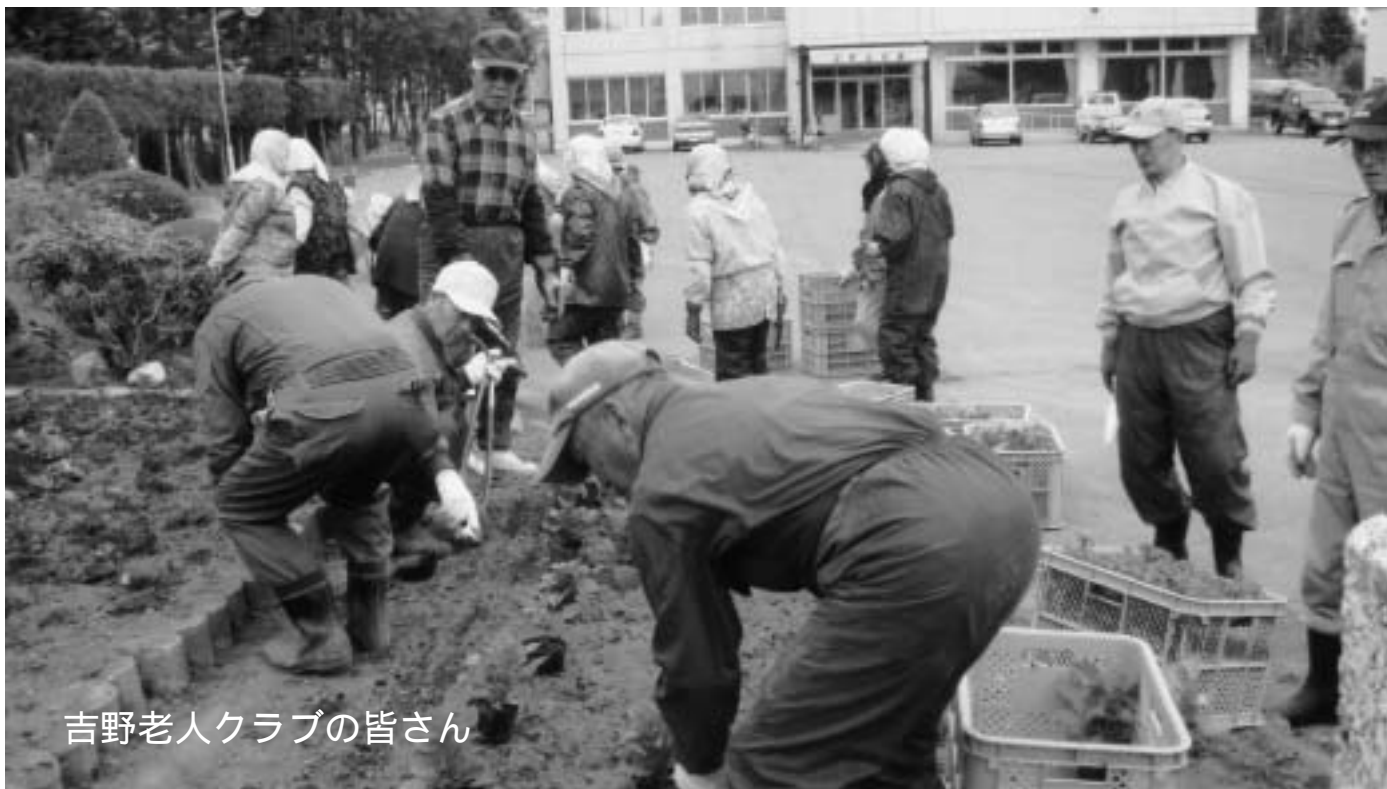
吉野老人クラブの皆さん