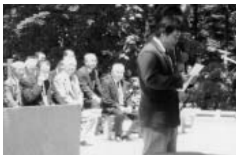
浦高生による平和の誓い