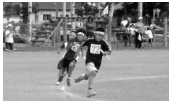
9月6日の小学生陸上競技記録会、大会新記録も出ました。