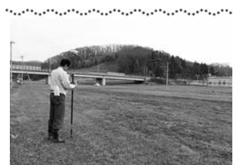
建設候補地の現況測量及び地質調査が始まりました

認定こども園では… 例えば、共働き世帯の 2 号認定のお子さんが保育所に通っていたけれど、一方が仕事を辞めたため 1 号認定となり幼稚園へ通う。また働き始めたので保育所へ…親の就労状況により預ける場所が変わりましたが、こども園では保育時間に違いはあるものの継続利用できます。