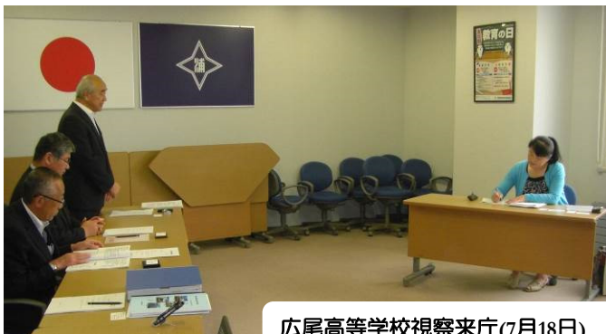
広尾高等学校視察来庁(7月18日)