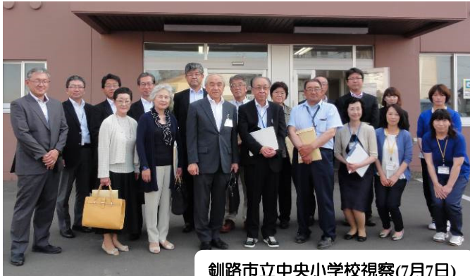
釧路市立中央小学校視察(7月7日)