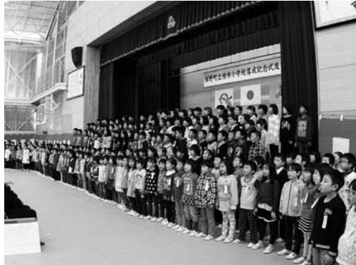
完成を祝い合唱する児童たち