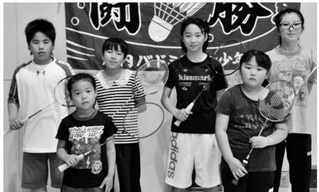
▼1▲ 全校一丸で活動する少年団