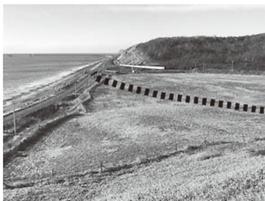
現在、海岸線を通過している道道1038号線(直別共栄線)は、オタフンベチャシの内陸側(写真点線)を通過するルートに変更が計画されている。

現在、この道道を、海岸線から離してチャシの内陸側へ迂回させる工事が計画されています。実現すると、チャシは直接太平洋に面することになり、チャシ周辺の景観が大きく変貌します。