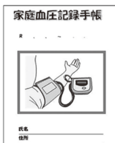
家庭血圧記録手帳

保健福祉センターでは、血圧手帳を無料配布しています。ぜひご利用ください！ 詳しくは、保健福祉課保健予防係まで！